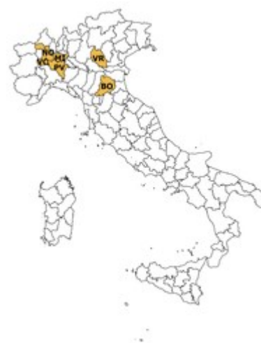
la rete di rilevazione Ismea